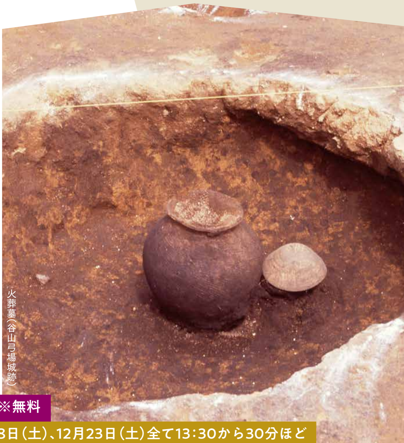
火葬墓(谷山弓場城跡)