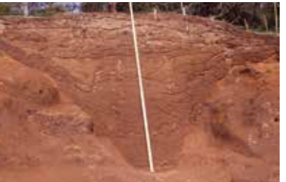
空堀(谷山弓場城跡)