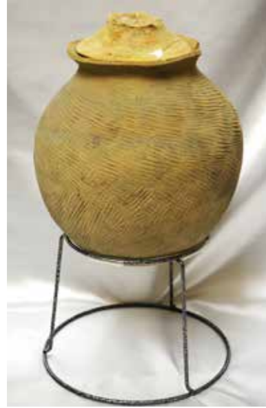
火葬墓検出蔵骨器 (谷山弓場城跡)