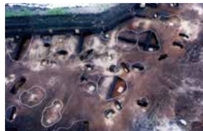
竪穴住居跡群(武遺跡)