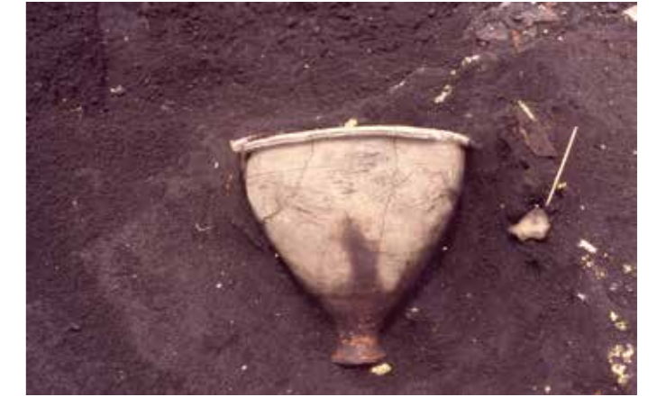
大溝検出甕(北麓遺跡)