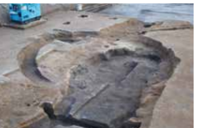
円形周溝墓(不動寺遺跡)