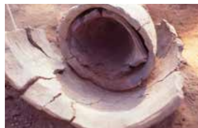
“入れ子”土器(帖地遺跡)