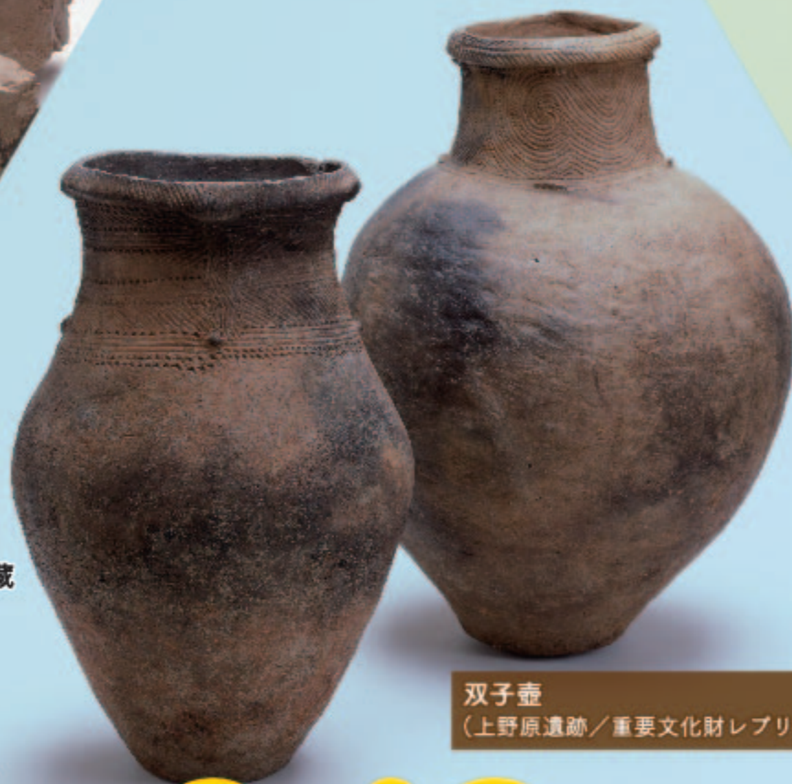
双子壺 (上野原遺跡/重要文化財レプリカ)