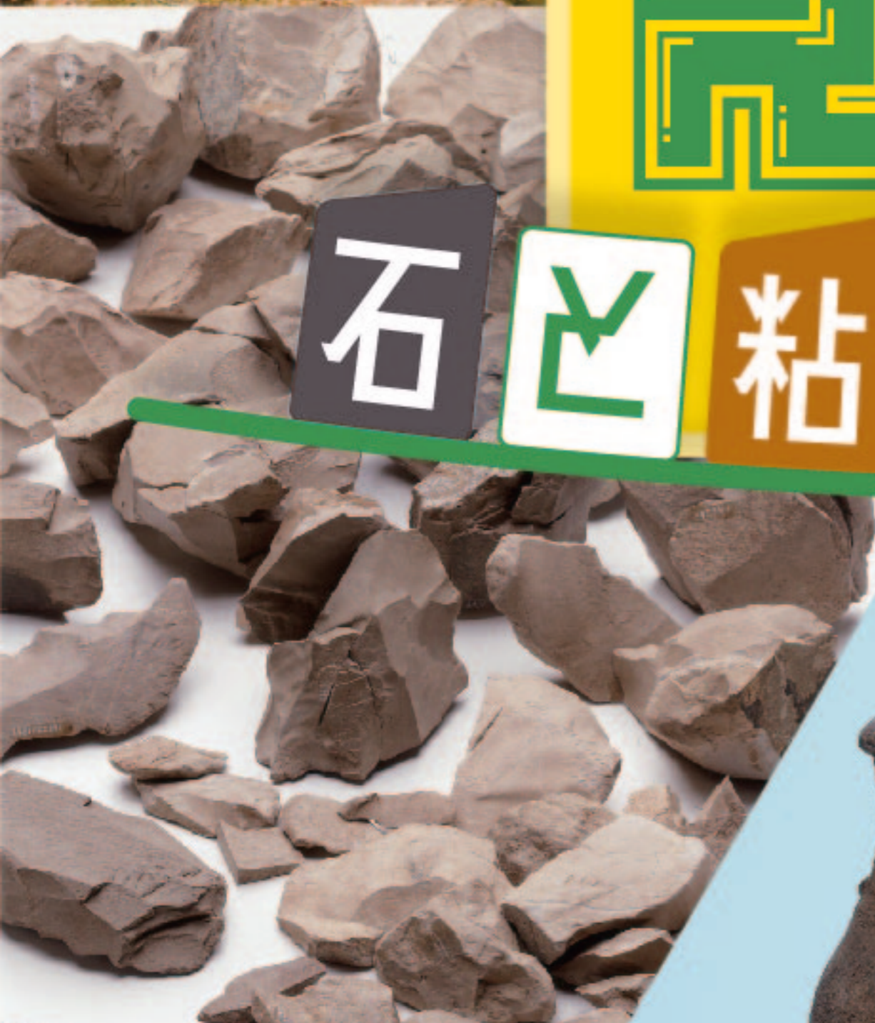
石器接合資料 (東郷坂A遺跡)