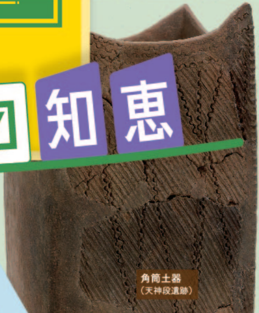
角筒土器 (天神段遺跡)