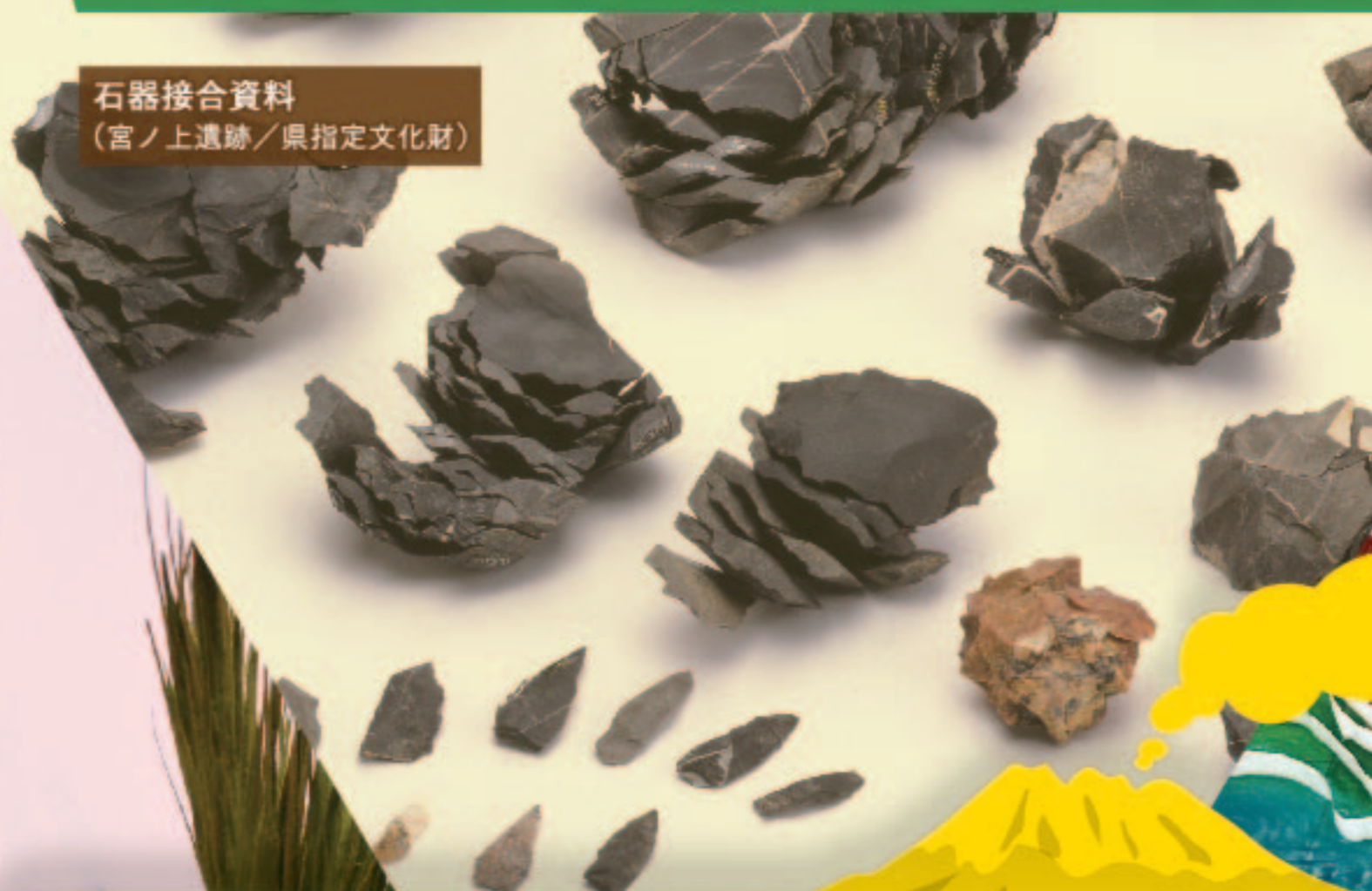
石器接合資料 (宮ノ上遺跡/県指定文化財)